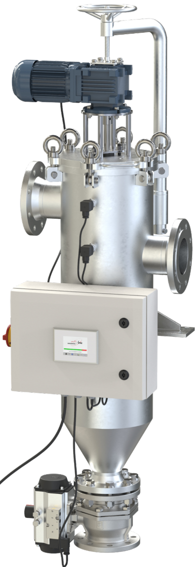
Kantenspalter AS325-FD mit Automatiksteuerung AS-E4-01

(Die Steuerung ist bei Lieferung nicht am Filter montiert und muss kundenseitig aufgehängt werden. Z. B. Wandmontage)